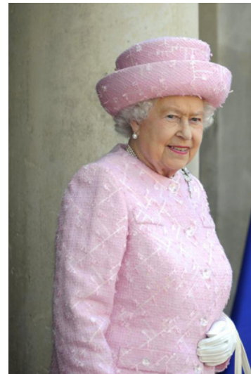
2. Elisabetta d'Inghilterra