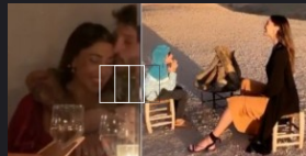
Belen Rodriguez e Stefano De Martino: balli, baci e tenerezze in