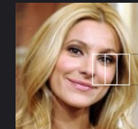
Giancarlo Magalli, la battuta al veleno (ancora!) contro Adriana Volpe. E lei