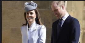
Kate Middleton, alla messa con la royal family è una meraviglia: ruba la